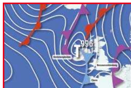
Wolkenkommunikation Cloud Computing Seite 38