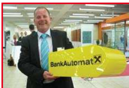
Banktechnik der Zukunft RB Hausmesse Salzburg Seite 28