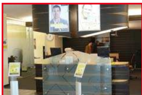
Form folgt Funktion Raiffeisenbank Laxenburg Seite 12